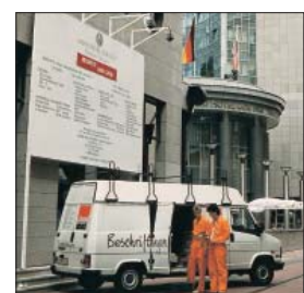
Lieferung & Montage