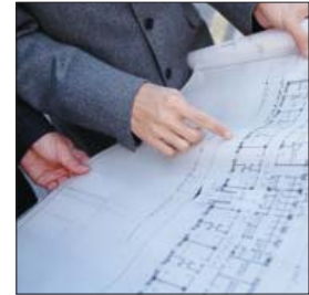
Planung & Projektierung